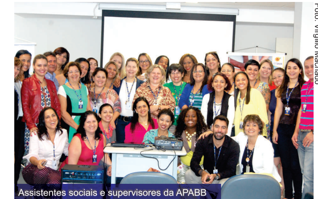
Assistentes sociais e supervisores da APABB