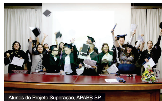
Alunos do Projeto Superação, APABB SP

O Núcleo Regional São Paulo formou 18 jovens com deficiência intelectual leve e moderada no Projeto Superação, patrocinado pelo Instituto Cooperforte; 15 já estão empregados. Foram 12 meses de aulas, divididas em dois módulos, em que foram abordados conteúdos de formação da cidadania (família e sociedade) e qualificação profissional (responsabilidade, direitos e deveres dos trabalhadores, relações de trabalho entre outras).