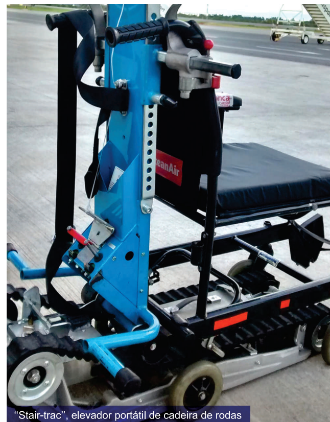
“Stair-trac”, elevador portátil de cadeira de rodas