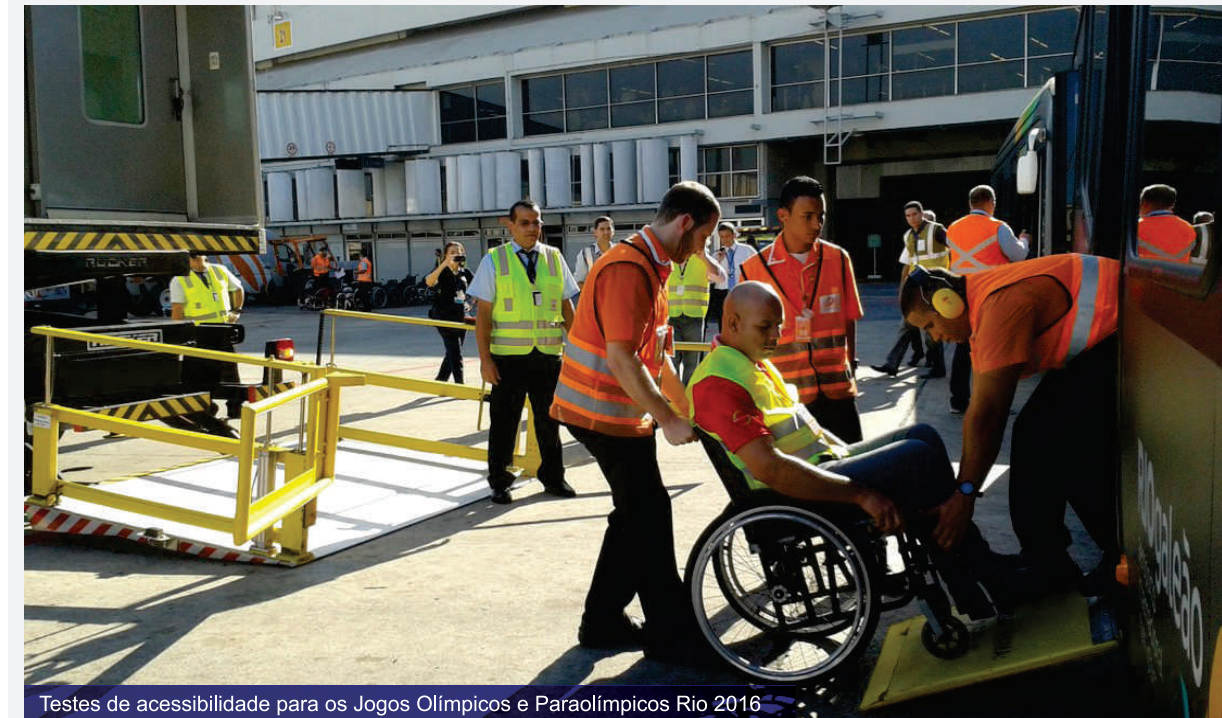
Testes de acessibilidade para os Jogos Olímpicos e Paraolímpicos Rio 2016