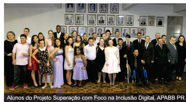
Alunos do Projeto Superação com Foco na Inclusão Digital, APABB PR

No Paraná, após seis meses do Projeto Superação com Foco na Inclusão Digital, patrocinado pelo Instituto Cooperforte, todos os 32 formandos conseguiram emprego. O sucesso foi tão grande que o NR está com lista de espera de pessoas e famílias interessadas em fazer parte de um novo projeto com as mesmas características.