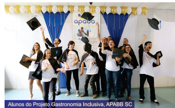
Alunos do Projeto Gastronomia Inclusiva, APABB SC

O Núcleo Regional São Paulo formou 18 jovens com deficiência intelectual leve e moderada no Projeto Superação, patrocinado pelo Instituto Cooperforte; 15 já estão empregados. Foram 12 meses de aulas, divididas em dois módulos, em que foram abordados conteúdos de formação da cidadania (família e sociedade) e qualificação profissional (responsabilidade, direitos e deveres dos trabalhadores, relações de trabalho entre outras).