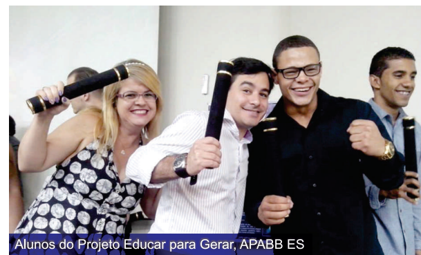
Alunos do Projeto Educar para Gerar, APABB ES

Ainda no Espírito Santo houve a formatura da primeira turma do Projeto Educar para Gerar, apoiado pelo Instituto Cooperforte. Dos 15 alunos capacitados no primeiro semestre, 13 já estão trabalhando. Uma nova turma, com 20 PcDs, começou no mês de agosto.