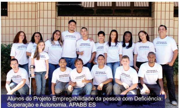
Alunos do Projeto Empregabilidade da pessoa com Deficiência: Superação e Autonomia, APABB ES

No Espírito Santo aconteceu a formatura da segunda turma do Projeto Empregabilidade da Pessoa com Deficiência: Superação e Autonomia, patrocinado pela Petrobras. No total, 20 alunos foram capacitados no curso de auxiliar administrativo e 17 já foram encaminhados ao mercado de trabalho.